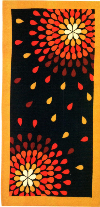
Ürün Adı: Colorful Plaj Havlusu Renk: Oranj