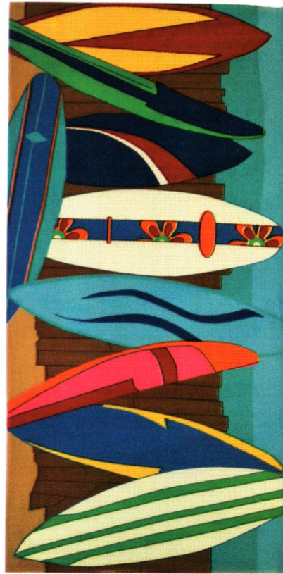
Ürün Adı: Surf Plaj Havlusu