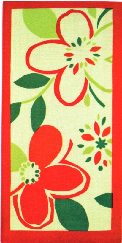
Ürün Adı: Jolly Plaj Havlusu