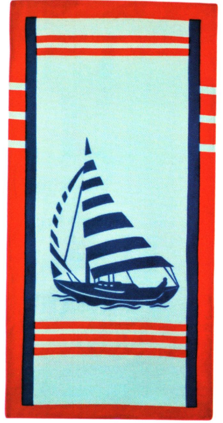
Ürün Adı: Pasific Plaj Havlusu