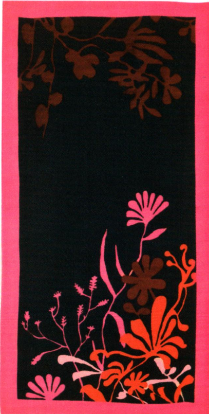
Ürün Adı: Paradise Plaj Havlusu